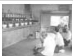
安室の六月ウマチー

このほか、 *我謝の獅子舞(ししまい) *棚原の五月ウマチー などのまつりの中からえらんで、見ることができます。