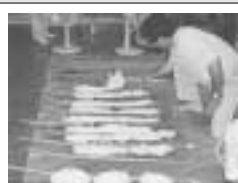
棚原の神酒 (ジンス) づくり