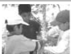
呉屋のウファチ網 (ジナ)