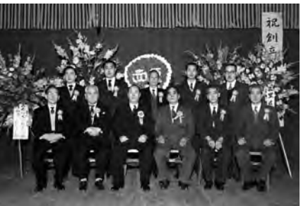
ペルー西原村人会40周年記念式典 役員のみなさんの集合写真 1959年9月17日