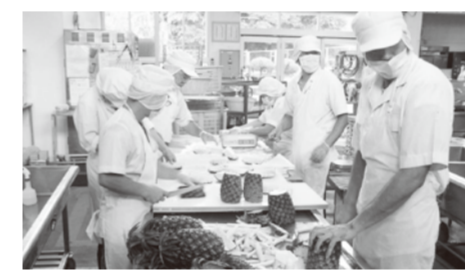
学校給食調理の様子

しているわけですから、そ れに基づき基準値内のもの を供給しているので安全と 回答した。 [町長] 広域火葬場・葬祭セン ターについて、当該施 設のない中部近隣市町村共 同による広域施設の建設を 検討してみてもいい。 [町長] 宜野湾市を核として 北谷町、北中城村、中城村と 本町において、同施設の建 設ができないか、この件に ついて事務レベルで協議し ている状況であります。広 域的な火葬場・葬祭場の建 設が望ましいと考えていま すので、今後、施設の規模 建設費用、財政的な補助メ ニュー、一番肝心な建設予 定地等について調査研究し て建設を考えていきたい。