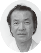
有田 力 議員

なさを感じた有権者が地方 から国を変える手がかりを つかんだ国民のまさに爽快 感を感じさせる選挙だった。 「職員の基本条例」や「教育 基本条例案」については、目 にした事がないので、後に 読ませていただきます。 問 愛知県の名古屋市中にお ける河村市長の「減税 方針」について西原町でも 考えるべきだと思いますが、 この不景気の中町民の暮ら しは苦しく、少しでも暮ら しが楽になるため、いろい ろな角度から減料金を「保 育料・給食費等」に実施すべ きと考えるがどうですか。 町長 町の現状からして、 自主財源等財源のなきのゆ え非常に厳しい。 問 公務員・職員の能力評 価制度の導入について の実施はありますか。 総務部長 勤務評定や評価 ランクづけについて課題は ありますが、導入できるよ う調査検討を致します。 問 職員採用試験について 第一次学力試験と第二 次面接試験等を同時に行い、 さらに集団討論や意見等で 高い人物評価で学力先行査 定から人物採用していき、