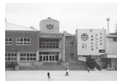
過密化が進む坂田小学校

何でメリットの答弁出てく るのか。一番の問題は、あな た方の過密化に対する基本 的な姿勢、立ち位置が間違 っている。学校長の過密化 の議員への説明資料を取り 上げ、これは情報公開条例 違反だ、地公法違反だ、始末 書の問題まで関わる」と上 から目線で校長、教頭を呼 出し叱責している。学校現 場の問題を学校長と共有し、 一緒に考えるのが皆さんの 立場ではないのか。 教育部長 始末書を書くと は一言も言っていない。情 報公開については指導した。 問 学校現場など有利な 立場にある教育委員会に呼 び出され叱責されれば、始 末書」とらえる事は当然 だ。保護者や児童の立場か らすれば、始末書求めら れるのは長期にわたり過大 規模校を放置した行政議 会ではないか。そんな暇が あれば、町長部局と過密化 解消の予算折衝をすべき。 学校長へ謝罪すべきだ。 教育長 公文書の取扱いが 問題で、その経過報告を求 めたのであって始末書を書 けとは言っていない。