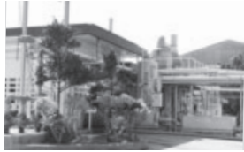
東部清掃施設組合の西原し尿処理施設

問 学校給食費の滞納整理について、教育委員会は頑張っている。処理要綱の中では最終的には法的手続きもやるといっているが、議会の承認が必要であるので、議会に対する提案も検討され、どの様に考えるか。