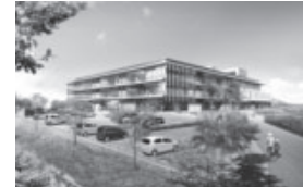
庁舎完成予想図(バース)

問 去る9月11日に新しい庁舎等複合施設建設に向けた安全祈願祭があった。庁舎の建物基礎は耐震性の基礎が施される予定であるが、それは震度何度まで安全なのか、また津波は新庁舎の場合、何メートルまでの想定がなされているか、いまだ度々それを確認したい。