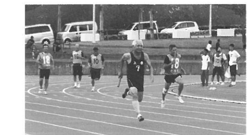
健康で若々しく(町陸上競技大会から60代リレー)

問 112筆、3万7、525平方メートルで県管理分が76筆、3万3、317平方メートル、町管理分は36筆、4、208平方メートルである。 問 今後どのような処置がとられるか。 総務部長 県の委託を受けて、今年度と来年度にかけて基礎調査、資料収集、台帳突合、測量調査、現状把握、周辺地権者等を初めとした聞き取り調査など行い、真の所有者への返還に向けて取り組んでいきます。 問 先述の不明地について、将来、墓地以外の不明地は県管理に、私には納得がいけないが、その件に町長の見解は。 町長 確かに県管理と市町村管理で区分して管理させるといふことは是非について、さらにまたその経過について私自身、よく把握はしていないが、何となく違和感を感じるところがあり、今後、この件につきましても、県と協議する機会、懇談会がありますので、その中で1つの議題として掲げて協議をしたい。その前に町村