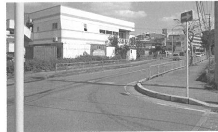
新県道の建設が進む柵原地域

取りつけは、 土木課長 当初の計画位置から約40メートル位坂田側に、寄せた形の図面を確認しており、その方向で調整しております。 問 自治会要請の3、町道翁長柵原線の一部、一方通行解除と道路拡幅について。 土木課長 現道が10メートルほどですが、車道部分を拡幅して11.5メートルで調整している所です。以上3件の要請は中部土木事務所も自治会の要請に沿って県警とも協議中でその地域は坂田交差点を中心事業が混在しているということ、もう少し様子を見て、また次回策、説明があると思います。