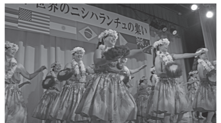
「世界のニシハランチュの集い」で歓迎の踊りを披露する中央公民館フラサークル

問 町陸上競技場の整備の機能の向上の確認をしたい。たくさん交付金を投資して整備してきたが、その効果はどうなのか。また、最終的に投資した金額はいくばくなったか。 【建設部長】 町陸上競技場の改修については、一括交付金を活用し、平成24年度から平成26年度の3年かけて、陸上競技場の改修、トレーニング器械・芝刈り機等の備品購入、車庫整備を行っております。総事業費は3億771万円となっております。次に投資効果については、まず機能の向上については、フィールド部分