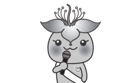
幼稚園教諭の職場環境や身分保障を考えなきゃ！

問 都市基盤の整備の件ですが、兼久、東崎線の進捗と国道から西原小学校までの道路整備は。 【建設部長】 町道東崎兼久線の用地補償は76.6%で63筆のうち47筆が契約済みで建物補償等は残り9件が継続交渉中です。西原小学校入人口までは用地2筆、建物は8件が契約済みです。