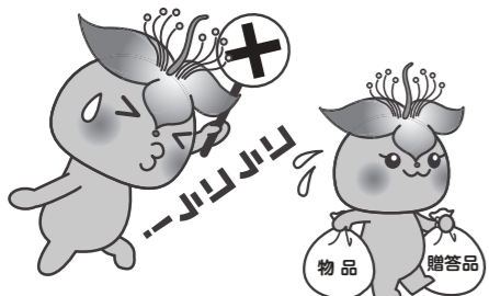
物品・贈答品は受け取りません!

問 正確な値段は本人が一番分かるので、正確に答えてください。 【町長】 議会事務局に返却したというのであれば、それ