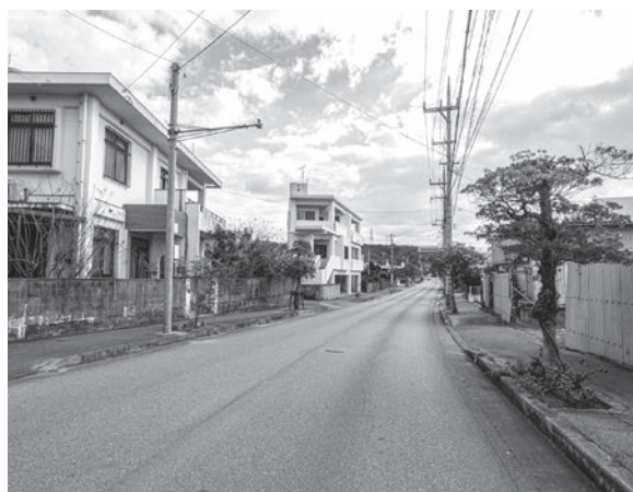
県道55号線冠水対策は！

教育長 議論がないと前進はない。西原町の規模の学校でそれに見合う施設の一体型か分離型か、その辺のハード面も含め教育委員会に提案し議論を深めていきたい。