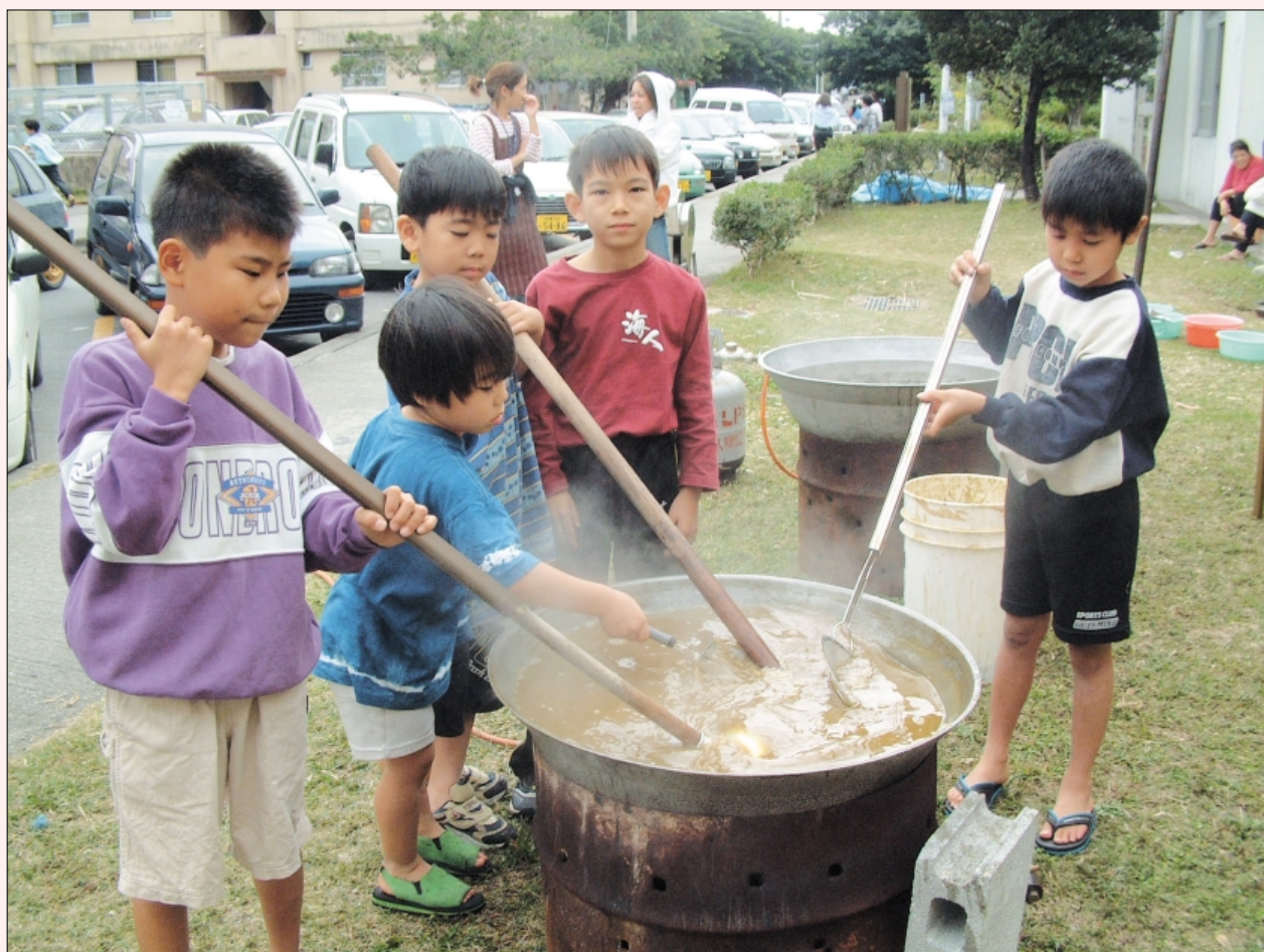
黒糖作りを体験学習する内間団地の子供会