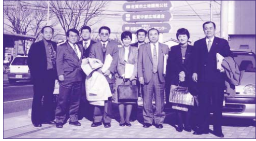
佐賀中部広域連合にて