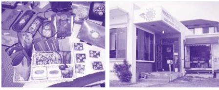
作業所で販売されている品々