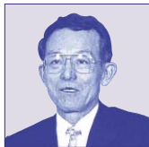
小川 孝 議員

問 鑑定評価が大分遅れているがその原因は何か？ 生涯学習課長 用地がまだ認定していないのが遅れている理由であります。 問 鑑定結果によって決めている理由が？ 生涯学習課長 現時点ではまだ決めておりません。今後土地鑑定評価を入れ、その鑑定結果によって決めています。 問 鑑定評価がその算定はどのような方法で決定されたか？ 生涯学習課長 現時点ではまだ決めておりません。今後土地鑑定評価を入れ、その鑑定結果によって決めています。