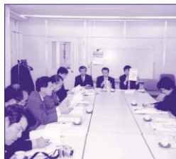
福岡町(福岡県)にて