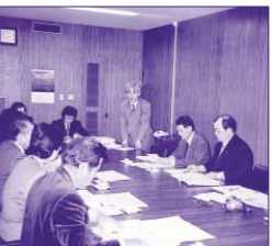
福岡県介護保険広域連合にて