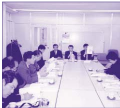
福岡町(福岡県)にて