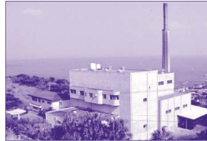
東部清掃施設組合

近年、住民生活の向上と生活様式の変化、経済活動の進展に伴い、廃棄物量は年々増加の一途をたどり、さらにゴミ質も多様化しており、それらの廃棄物を適正に処理処分し、清潔で快適な住み良い生活環境を守ることが行政の重要な課題である。