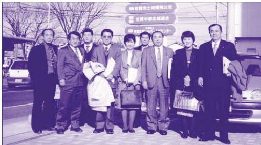
佐賀中部広域連合にて