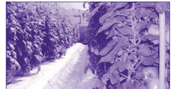
冬場のゴーヤー、トマト(字嘉手苅)

問 テニスコートの造成工事が着工されていますが、テニス愛好家は中学生から一六〜一七才まで幅広い年齢層であり本町の人からみて六面は必要である。コート面は人工芝、ゴム、コート面の基準、ナイター設備等の計画はどうなっているか。開設に向けての検討委員会はもたれたか伺う。 町長 四面で一定の施設の中で町民が各競技に参加し効率的に利用し得る施設に