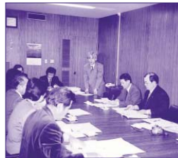
福岡県介護保険広域連合にて