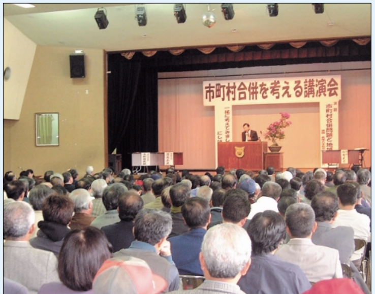
町議会主催による市町村合併を考える講演会に町内外から約400人が参加しました。

市町村合併の問題が大きな課題となっていますが、西原町を含め、県内の市町村でも大きな動きが出て来ています。各議員は、各種研修会や講演会等へ積極的に参加し、議会でも特別委員会を立ちあげて調査研究に取り組んでいます。