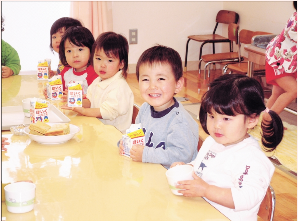
おやつタイムだよ！（坂田保育所の良い子たち）