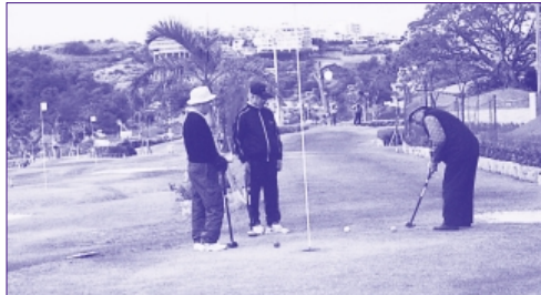
団体割引等の要望が出されているパークゴルフ場

教育長 県の方で今年度中に各市町村に説明を行い、十五年度でどういう競技にするか調査に入り、十六年度に会場の決定が行われるようです。県の方から説明があった時に町の体協とも協議し町の意向を伝えていきたいと考えています。