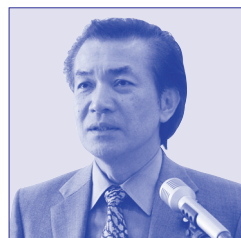
有田 力 議員

この一般質問の内容は、会議録(録音テープ)に基づいて各議員が原稿をまとめ、編集委員会が最終確認をしたものです。