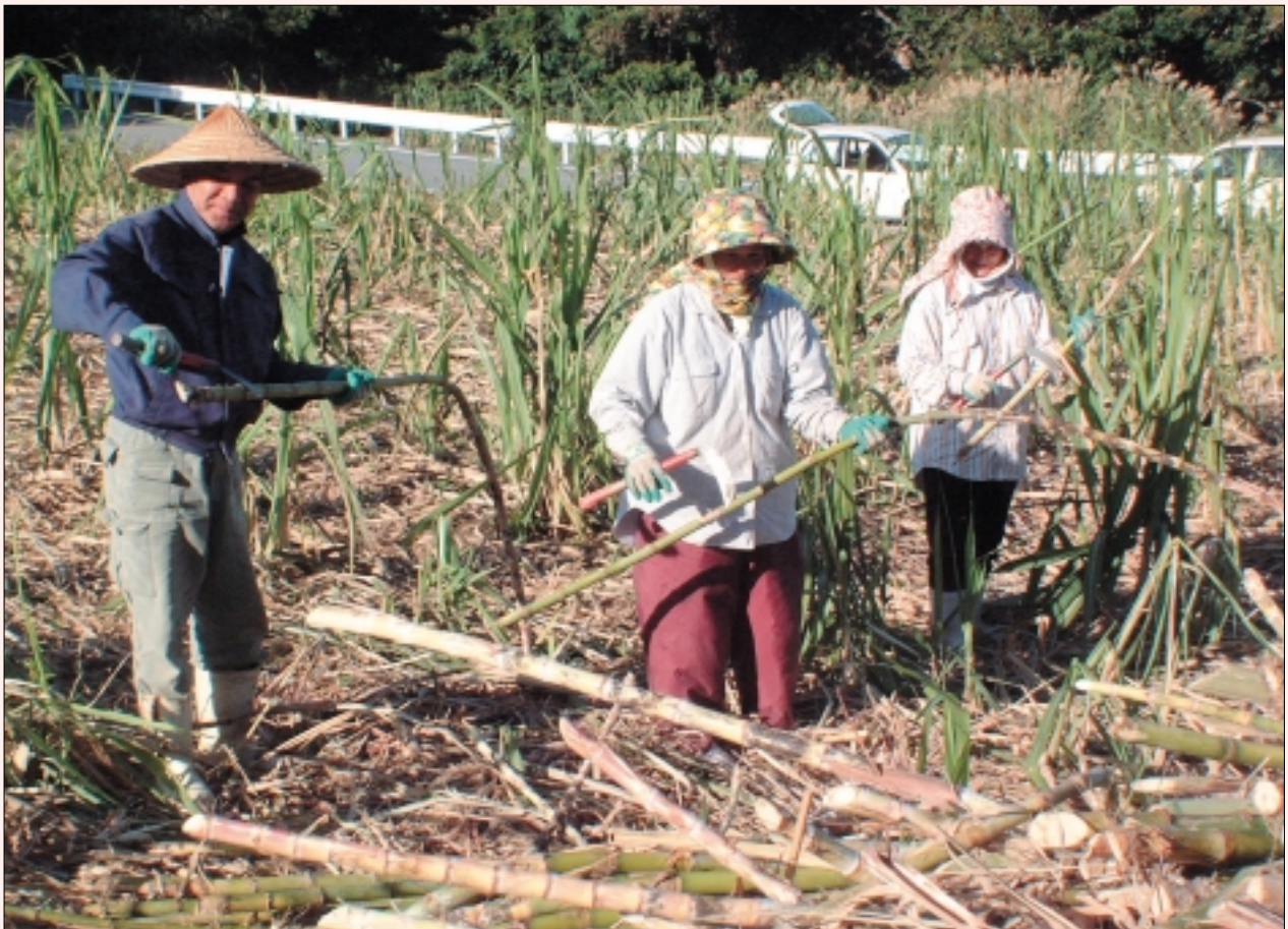
キビ刈りに精を出す農家の皆さん

〒903-0220 沖縄県中頭郡西原町字嘉手苅112番地 TEL.FAX 098-945-5005 発行：西原町議会 編集：議会広報調査特別委員会 印刷：(協)丸正印刷