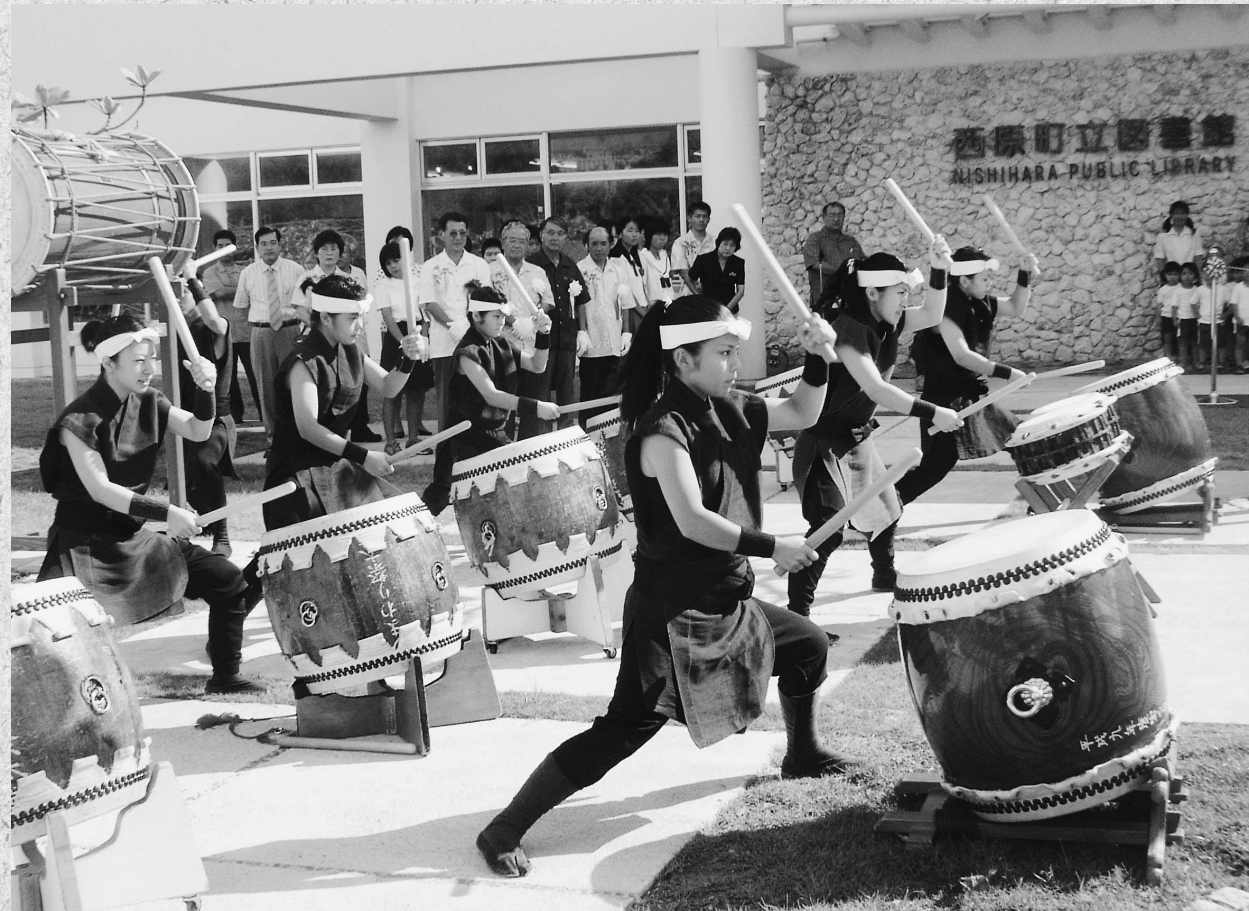
図書館オープンを祝う舞葵琉太鼓

住所:〒903-0220 沖縄県中頭郡西原町字嘉手苅112番地 TEL:098-945-5005 発行:西原町議会 編集:議会広報調査特別委員会 印刷:(株)尚生堂