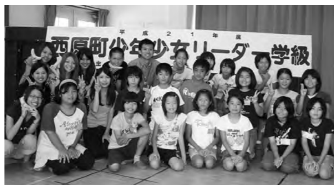
8/17 キリスト教学院大学生の講師の皆様と!