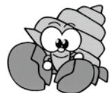
●中城湾南部流域下水道促進協議会 キャラクター(オカヤドカリ)