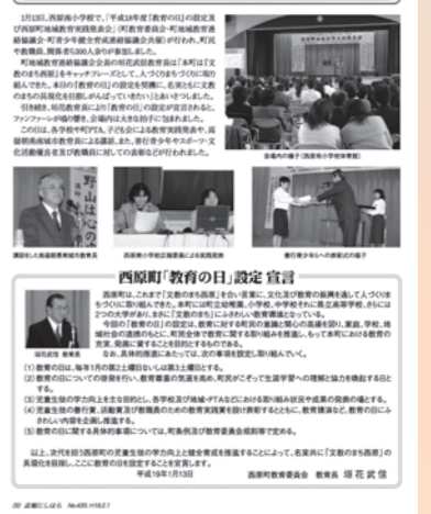
文教のまちの推進を目指して平成19年から始まった「西原町教育の日」。現在も、毎年2月の第1土曜日に式典が行われています。 【平成19年2月号】