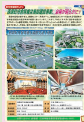
来年完了予定の庁舎等複合施設建設事業も、紙面で紹介してきました。 【(左)平成24年3月号】 【(下)平成24年10月号】