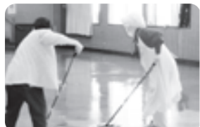
大ホールもワックスでピカピカ!

中央公民館サークルの会員、公民館利用団体、一般ボランティアのみなさんなど、140名余りの方が清掃ボランティアに参加し、きれいに清掃することができました。