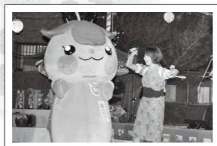
梅の香りうた遊び大会