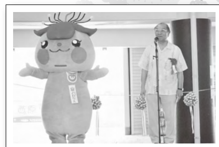
きらきらビーチ海びらき