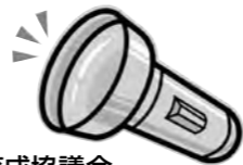
問合せ 西原町青少年健全育成協議会 ☎945-5036