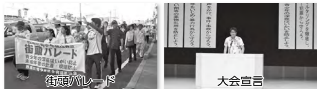
街頭パレード 大会宣言 問合せ 西原町青少年健全育成協議会 ☎945-5036

7月15日(水)にさわふじ未来ホールで、第35回西原町青少年健全育成総決起大会を開催しました。約300名の方に参加をいただき、青少年の主張発表やネット問題に関する講演、大会宣言を行いました。大会終了後には、西原高等学校マーチングバンド部を先頭に街頭パレードを行い、青少年の非行防止や健全育成を呼びかけました。また、7月17日(金)には、一斉夜間巡回指導を行い、青少年に帰宅を促しました。