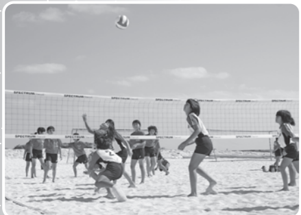
ビーチバレー大会

さらに、町民陸上競技場等を活用し、プロサッカーチーム等のスポーツキャンプ誘致を推進しており、昨年度に引き続き、Jリーグクラブのキャンプが予定されています。