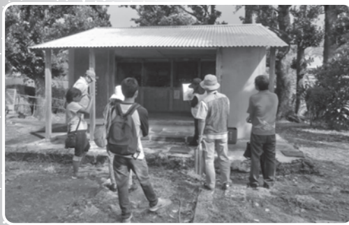
ガイド養成講座（内間御殿）

平成三年は、尚田王即位五五〇年にあたり、記念事業を検討する委員会を平成一八年度より立ちあげました。