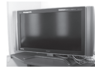
平成18年式 シャープ製 フルハイビジョン液晶テレビ LG-37GX2W