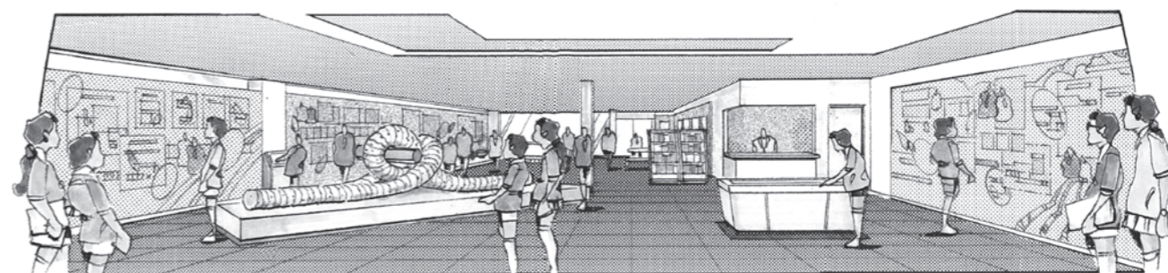
歴史文化展示施設(観光案内所)のイメージ

また、町内の観光資源の紹介やイベント等の地域情報を発信する観光案内所としての機能も併設し、観光振興を図ります。