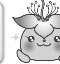
さわりん 西原町全部