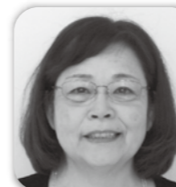
花城 るみ子 幸地・県営幸地高層 幸地ハイツ

そうなんだ!じゃ、みんな母子保健推進員の人達に身体測定してもらっているんだ!ん? 「こんにちは赤ちゃん訪問事業」ってなあに?