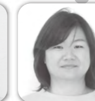
小谷 林 我謝