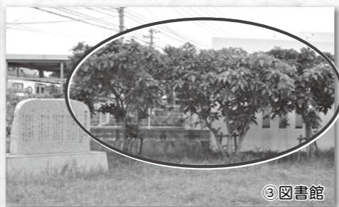
円で囲んでいる木が「サワフジ」です

※サワフジを見に行く際は、近隣住民に迷惑がかからないよう、ご配慮ください。 ※懐中電灯が必要です。