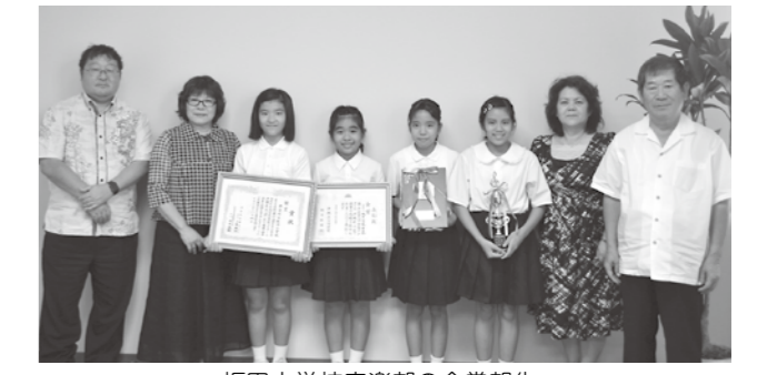
坂田小学校音楽部の金賞報告