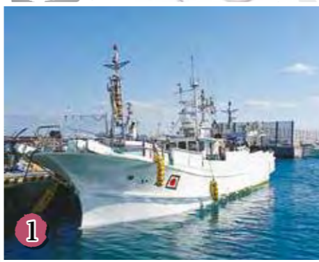
奄美大島沖から当添漁港(与那原町)に帰港