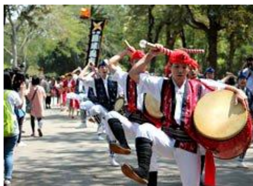
台湾の東海大学で演舞披露