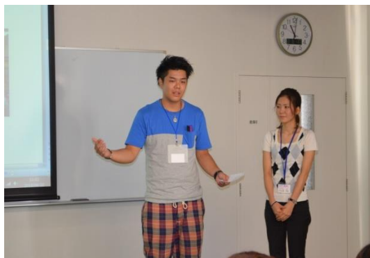
各大学生サークルから活動内容の発表