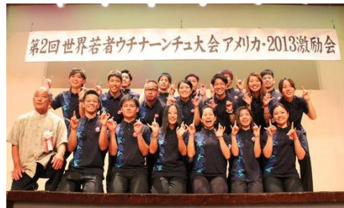
第2回世界若者ウチナンチュ大会 アメリカ・2013 激励会