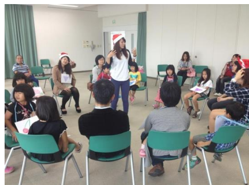
子どもたちと英語でゲームをしている (えいご de あそぼう)