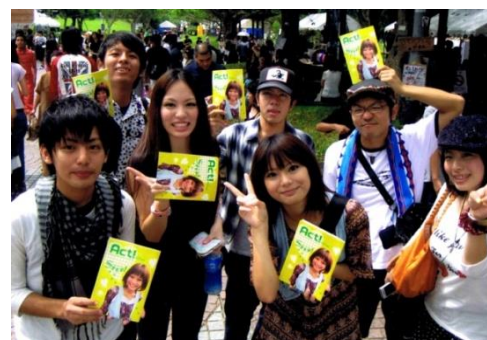
沖縄県内の大学生に向けて フリーマガジンをお届けしている様子