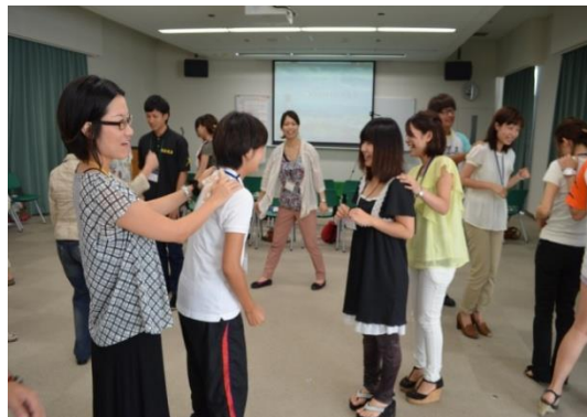
じゃんけん列車を通して自己紹介