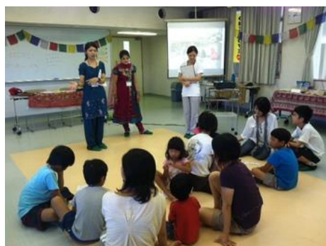
子どもたちとのワークショップ