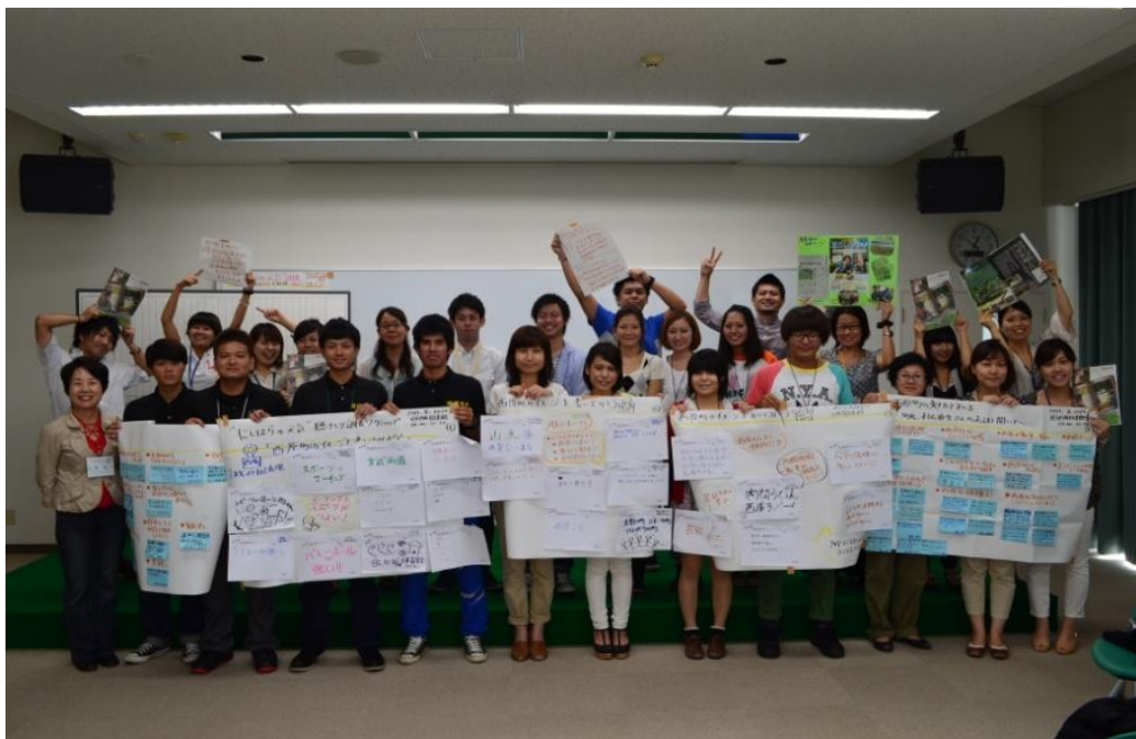
2013, 8, 10 “にしはらの元気” 聴き取り調査ワークショップ

西原町内、また西原町近隣には多くの文化教育施設があり、町民として町内または近隣で活発に活動する大学生サークルがいます。大学生サークルという若者の視点や可能性が“にしはらの元気”になり今後の西原の充実・発展の芽になることを期待して聴き取り調査ワークショップをしました。