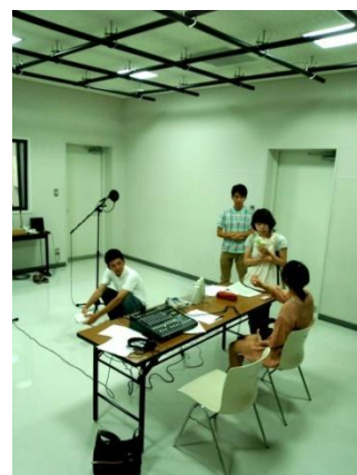
作品制作のため、スタジオで収録している