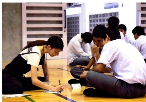
高校生と将来の話をしている様子