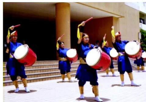
沖縄祭での演舞披露