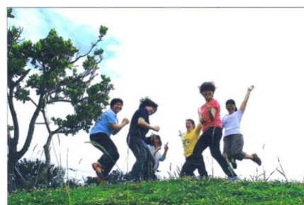
フィールドワーク時のメンバー

沖縄の魅力を他方向（過去・現在）な視点や様々な学問から発見し、発信していること！