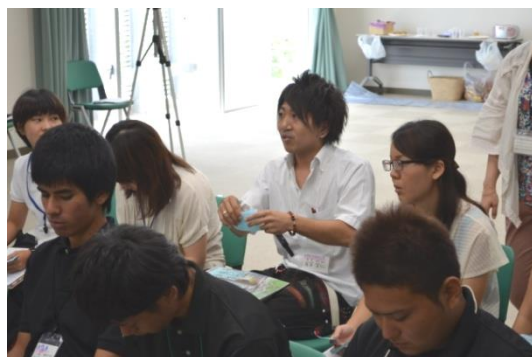
参加者からの気づきを共有