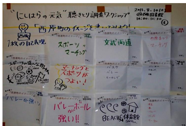
「西原町のイメージ」ワークシート