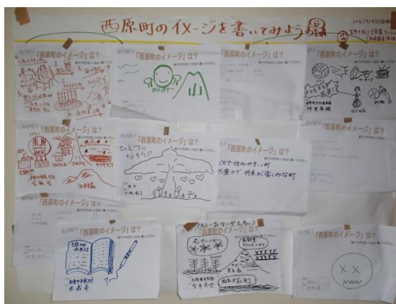
「にしはらのイメージ」ワークシート